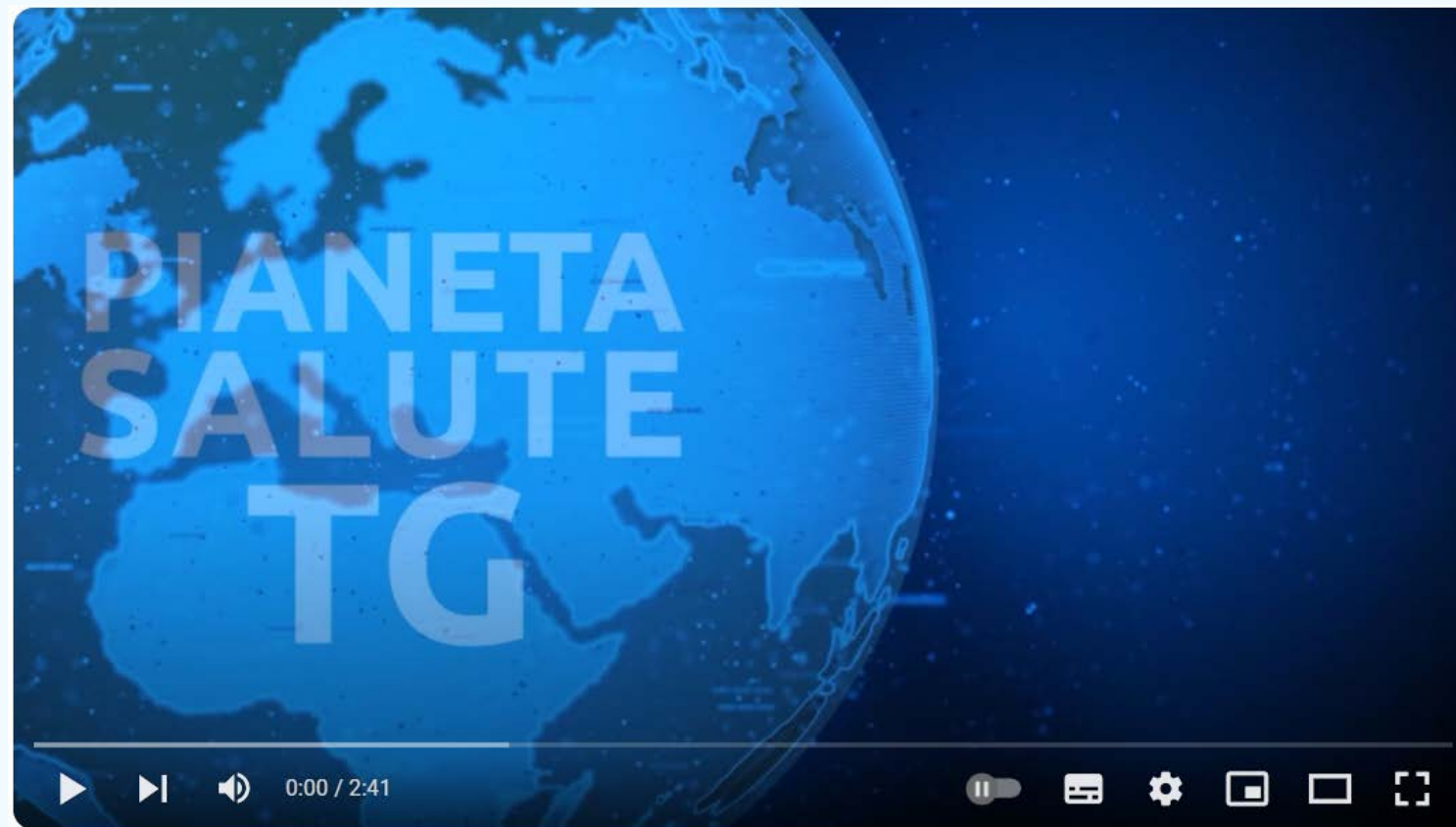
Università, Salute e Innovazione: La Rivoluzione Tecnologica che Cambia la Sanità

https://www.youtube.com/watch?v=m6M9vUVFZp0