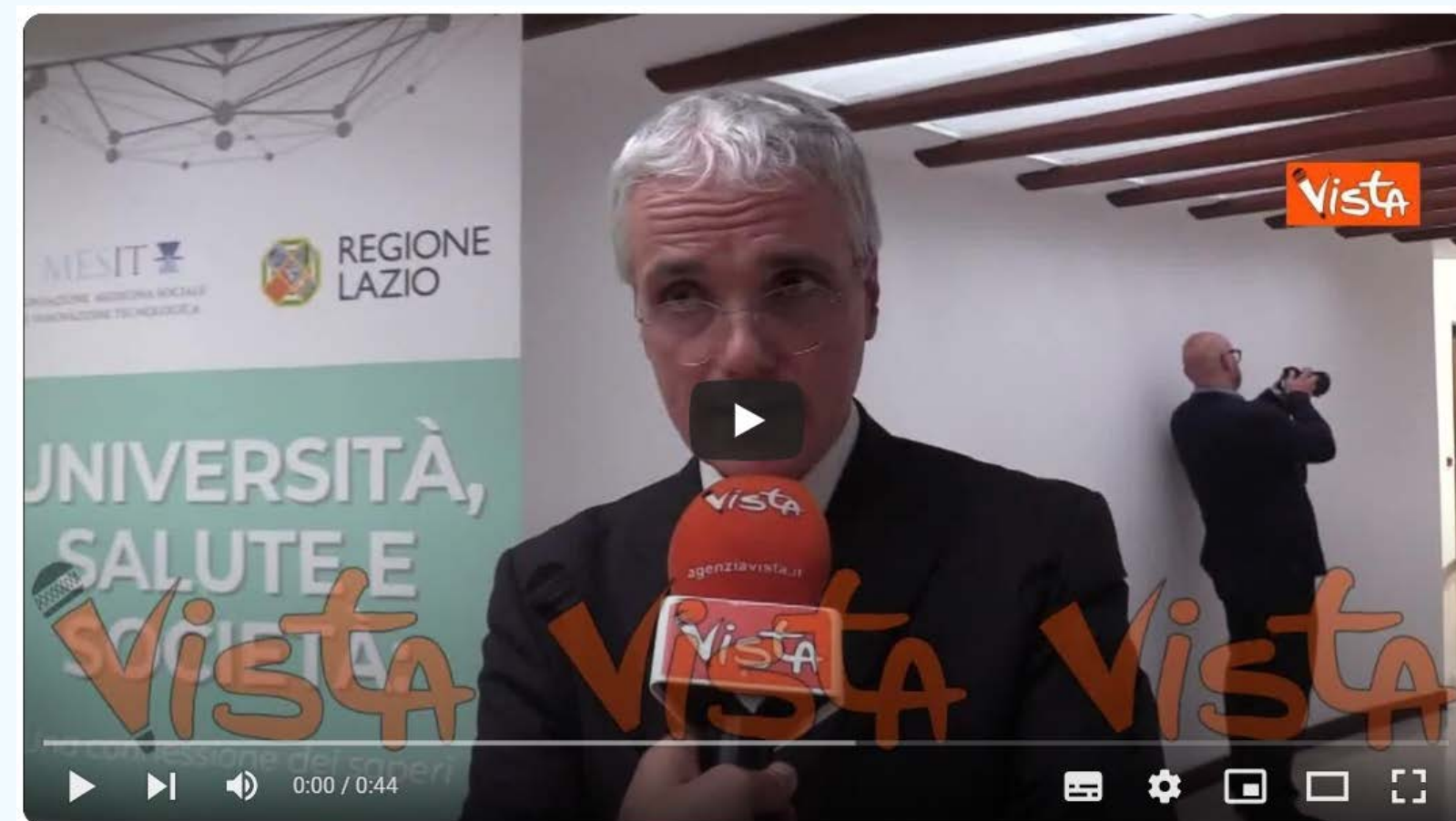
Sacchini (Università Sacro Cuore): "Il sistema sanitario deve fissare nuovi criteri etici"

https://www.youtube.com/watch?v=1lwU5HNqFZk