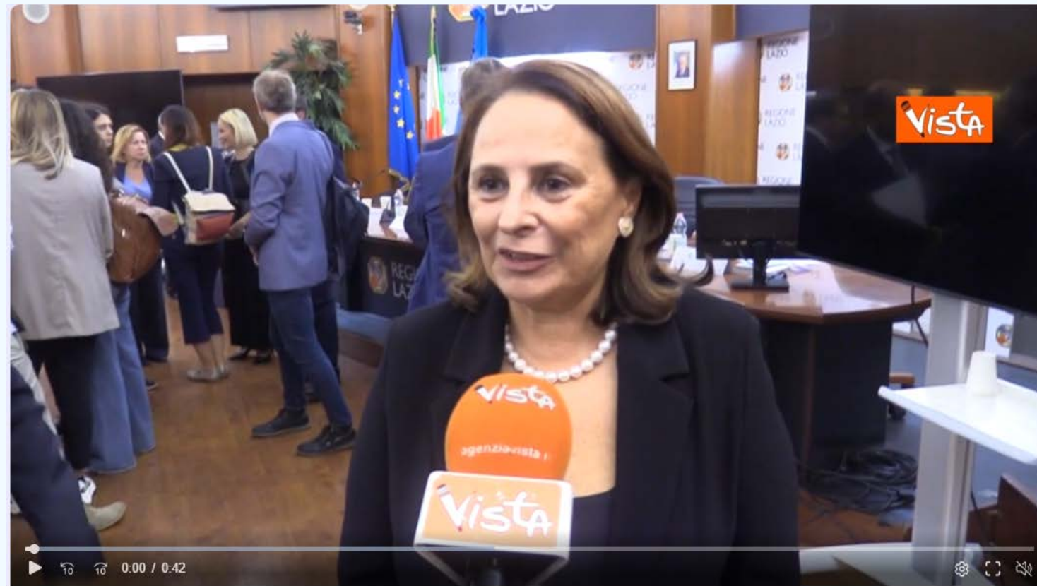
Agenzia Vista + Regimenti (assessora Regione Lazio): "Serve una sanità equa e vicina ai cittadini" (Agenzia Vista) Roma, 25 settembre 2024 "Un importante convegno oggi in cui si è parlato di università, salute e società. Abbiamo avuto importanti relatori che hanno affrontato il tema da... Vedi altro

https://www.msn.com/it-it/video/notizie/regimenti-assessora-regione-lazio-serve-una-sanit%C3%A0-equa-e-vicina-ai-cittadini/vi-AA1rctJI