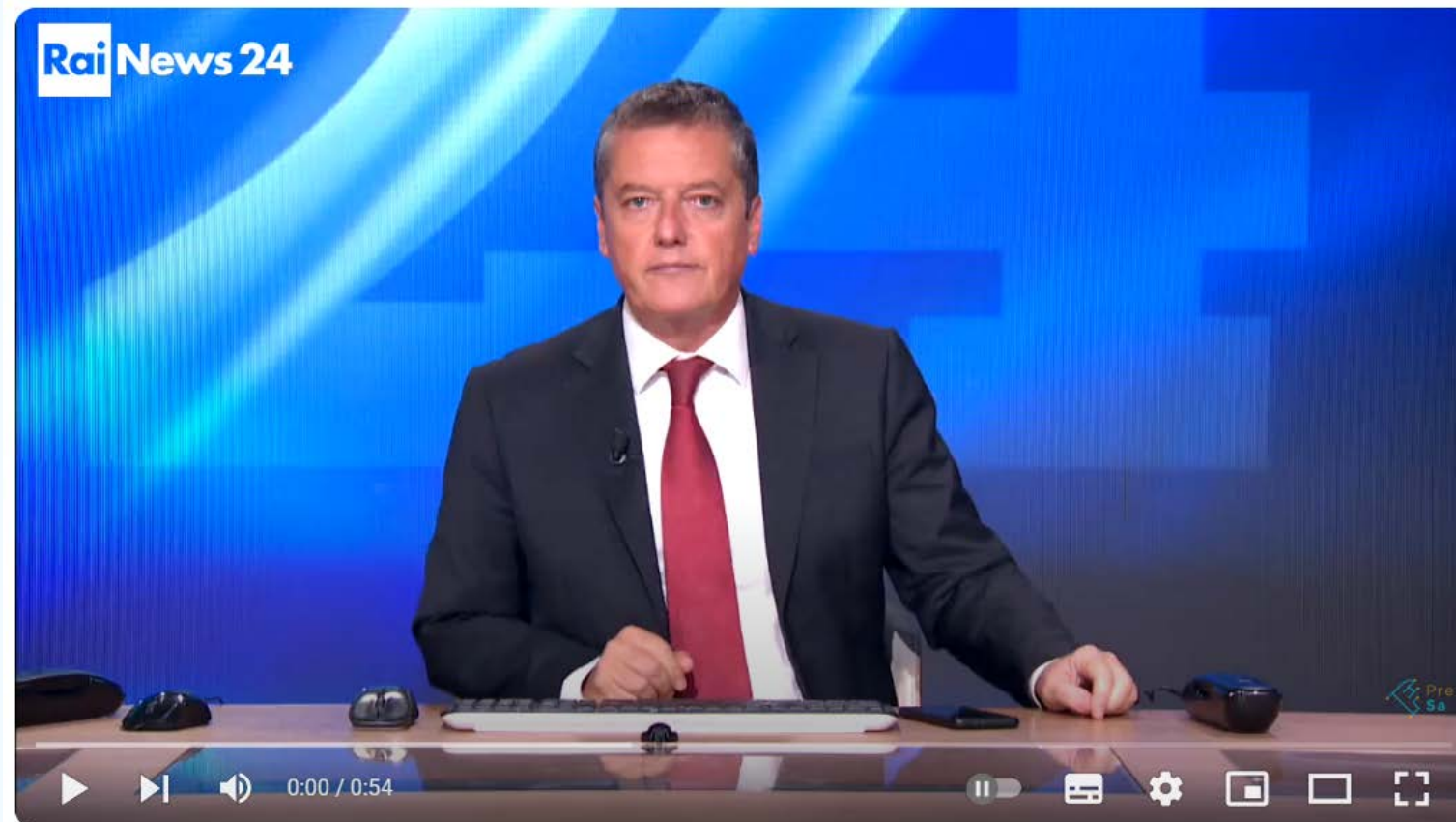
RaiNews24 - Università, Salute e Società

https://www.youtube.com/watch?v=BAdy61GmISA&t=3s