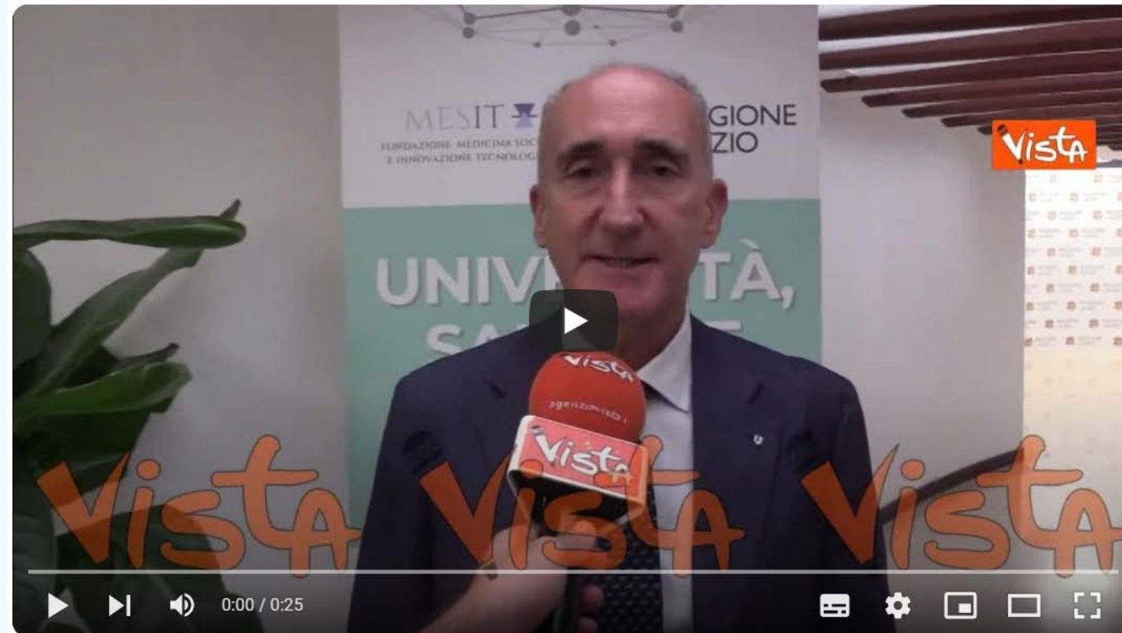
Ghiron ( Rettore Tor Vergata): "Serve offerta formativa sanitaria al passo con i tempi"

https://www.youtube.com/watch?v=zsG01fLP0lw