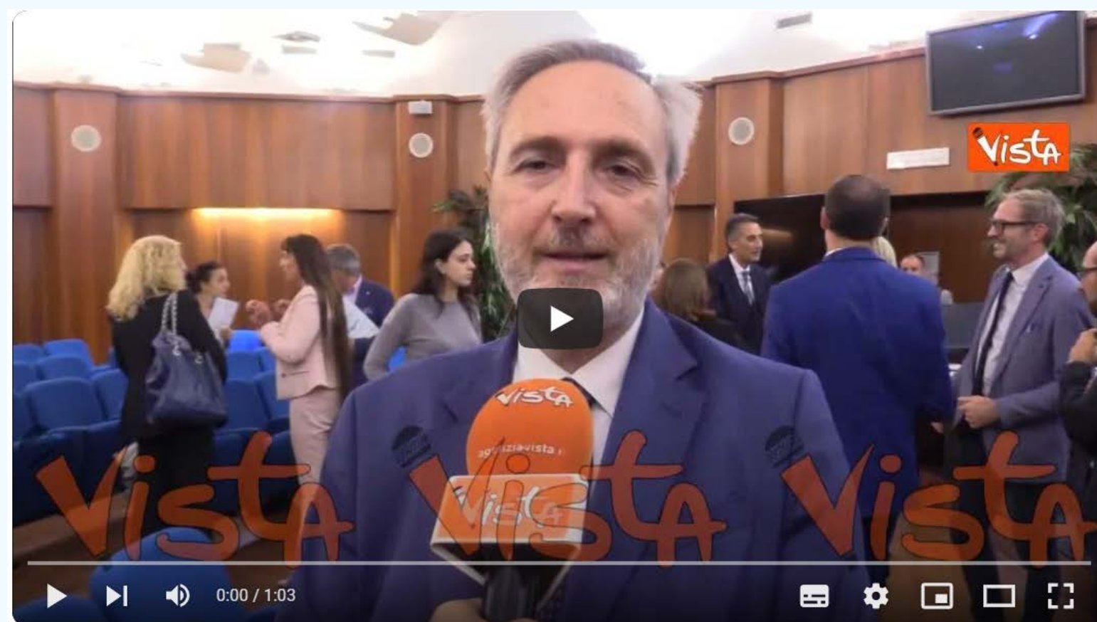
Leonardi (Ministero Salute): "Non c'è salute umana senza salvaguardia ambiente e animali"

https://www.youtube.com/watch?v=X0ZJSprJh0M