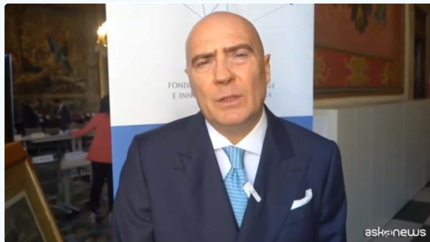
Manovra, Cattani (Farmindustria): proseguire percorso di riforme

https://www.dailymotion.com/video/x97uoym